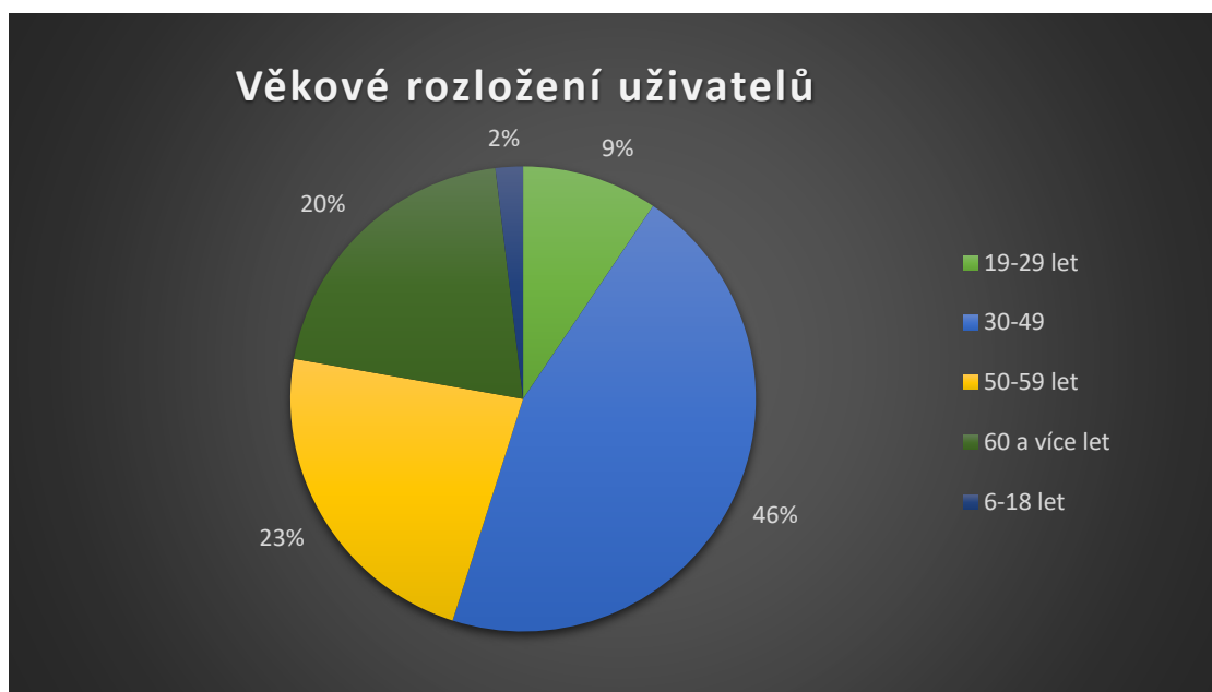
Graf č. 1. Věkové rozložení uživatelů v procentech

Pozn. Věk uživatele se sleduje pouze u samotných hovorů