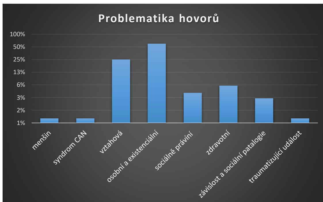
Graf č. 3 Procentové vyjádření problematik, s kterými lidé volají

Pozn. Uváděný statistický graf je z nejčastěji zastoupených problematik, nelze je porovnávat s celkovým počtem přijatých kontaktů – v mnoha kontaktech se problematiky kombinují. Proto je počet uváděn v procentech.